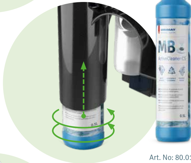
Art. No: 80.016

Eine kurze Drehung mit der Hand und die MB-AktivReiniger-RS Flasche sitzt fest in der Halterung.