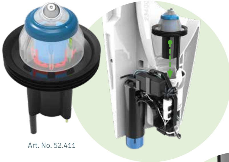
Art. No. 52.411